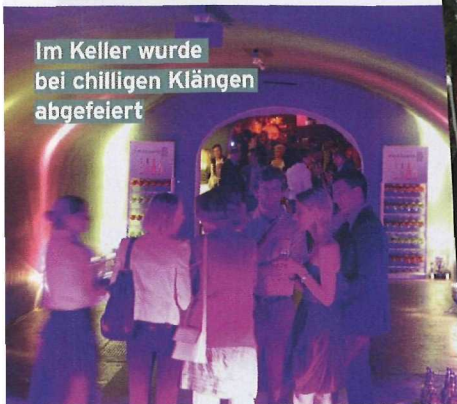
Im Keller wurde bei chilligen Klängen abgefeiert