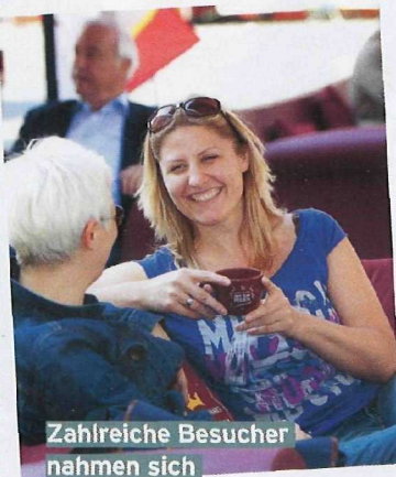
Zahlreiche Besucher nahmen sich „Zeit zum Reden“